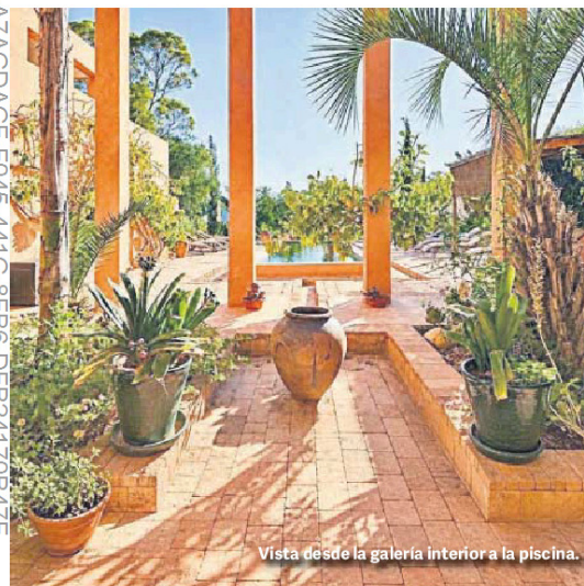
Vista desde la galería interior a la piscina.

Pierre de Cabarrús llegó a Níjar en la década de 1970 cuando lideraba negocios agrícolas en el sur de España —su empresa