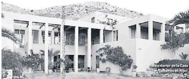
Vista exterior de la Casa Cabarrús en Níjar.

La Casa Cabarrús emerge entre un paisaje de olivos, acequias y balates de piedra. Se desarrolla en un conjunto de volúmenes de geometría sencilla unidos por una galería formada